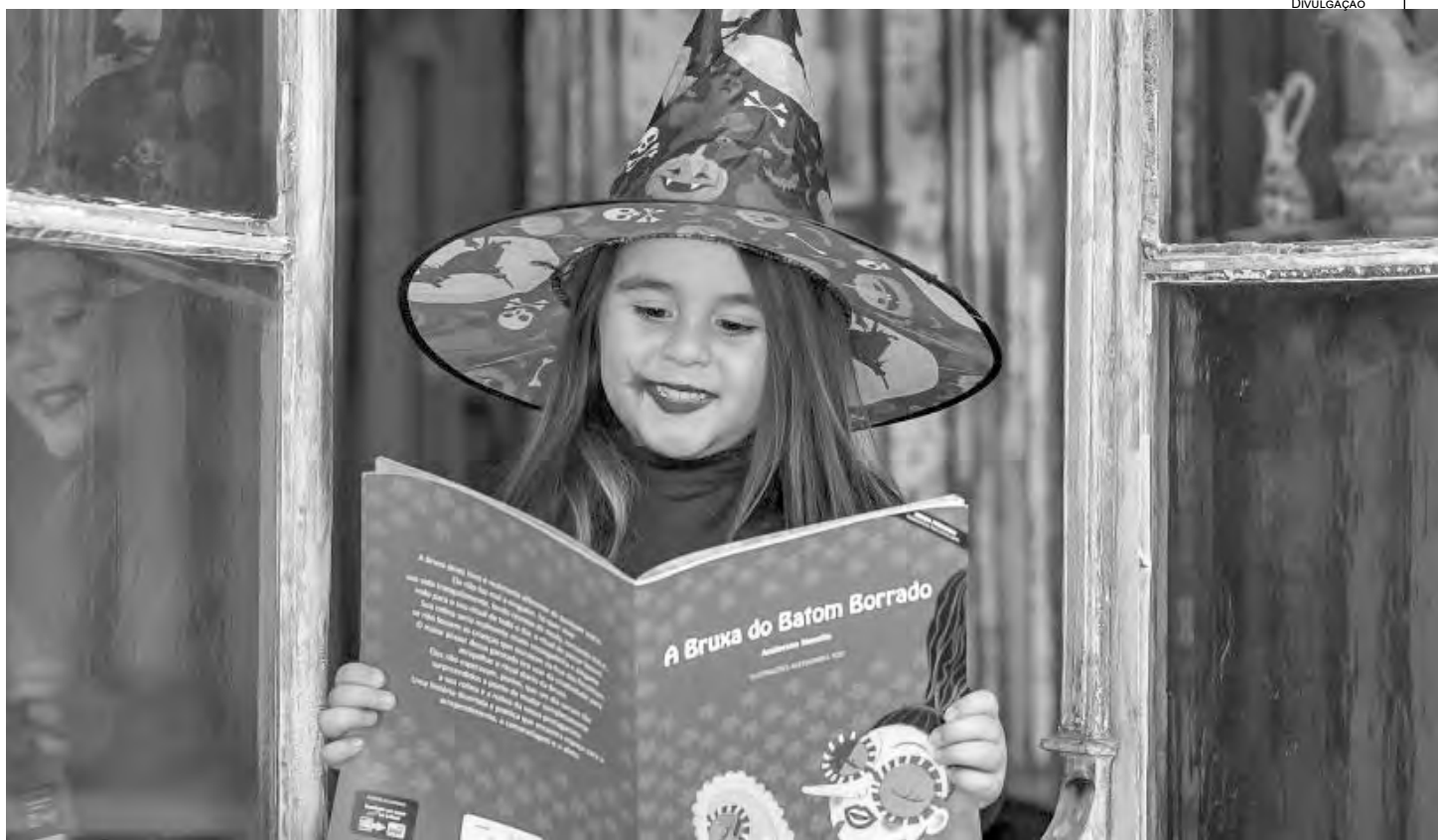
OBRA infantil do escritor Anderson Novello, com ilustrações de Alessandra Tozi

LIVRO Instituto chega à marca de 27 mil exemplares impressos em 2021, com patrocínio de empresas e recursos do Nota Paraná